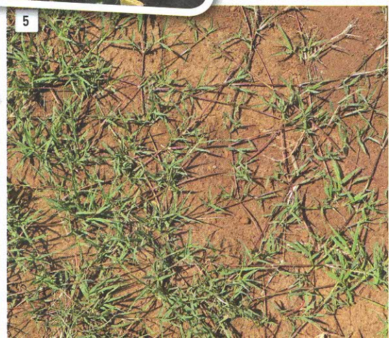
▲ 1: Purperwinde. ▲ 2: Wilde lusern. ▲ 3: Geel uintjies. ▲ 4: Rooi uintjies. ▲ 5: Kweekgras.